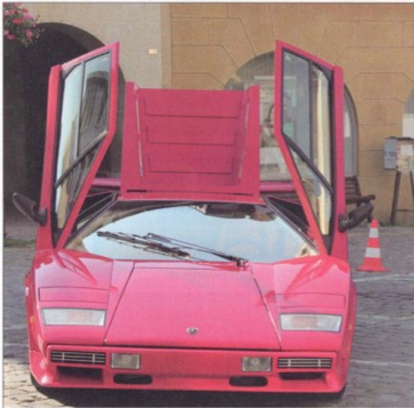
Lamborghini Countach.

La place du Marché et la Grand-Rue d'Orbe ont accueilli samedi dernier une bonne trentaine de véhicules de collection, les plus anciens datant des années 1930, sans oublier un véhicule pompier hippomobile.