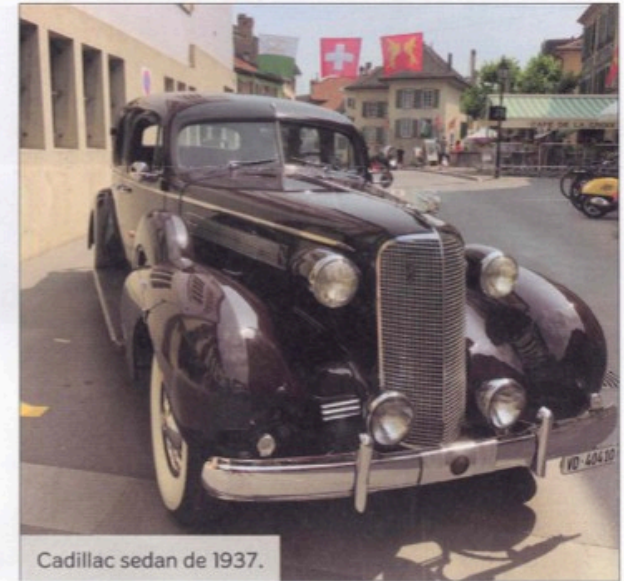
Cadillac sedan de 1937.

Un nombreux public avait fait le déplacement, sensible au charme de ces anciennes qui ont été abondamment photographiées en ce samedi ensoleillé.